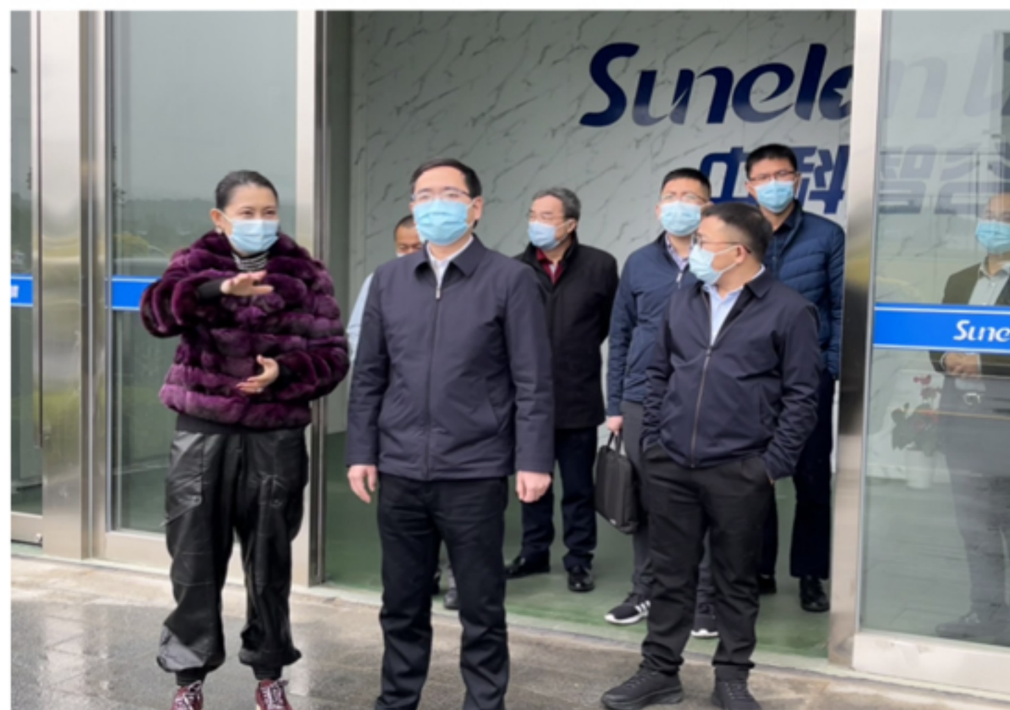
林少金副市长详细了解企业市场开拓等情况