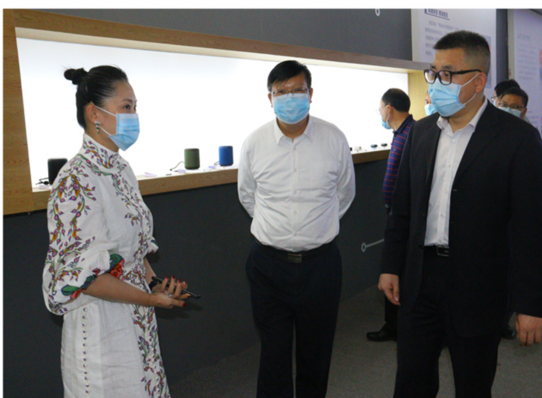
双方就企业相关情况进行深入交流