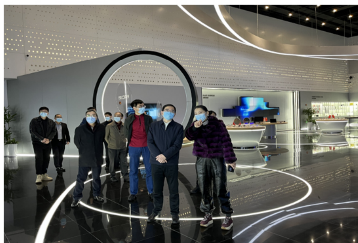
漳州市副市长林少金一行莅临中科智谷产业园调研

林少金副市长鼓励企业不断提高产品科技含量和附加值，增强企业的竞争力，持续转型升级、做优做强。