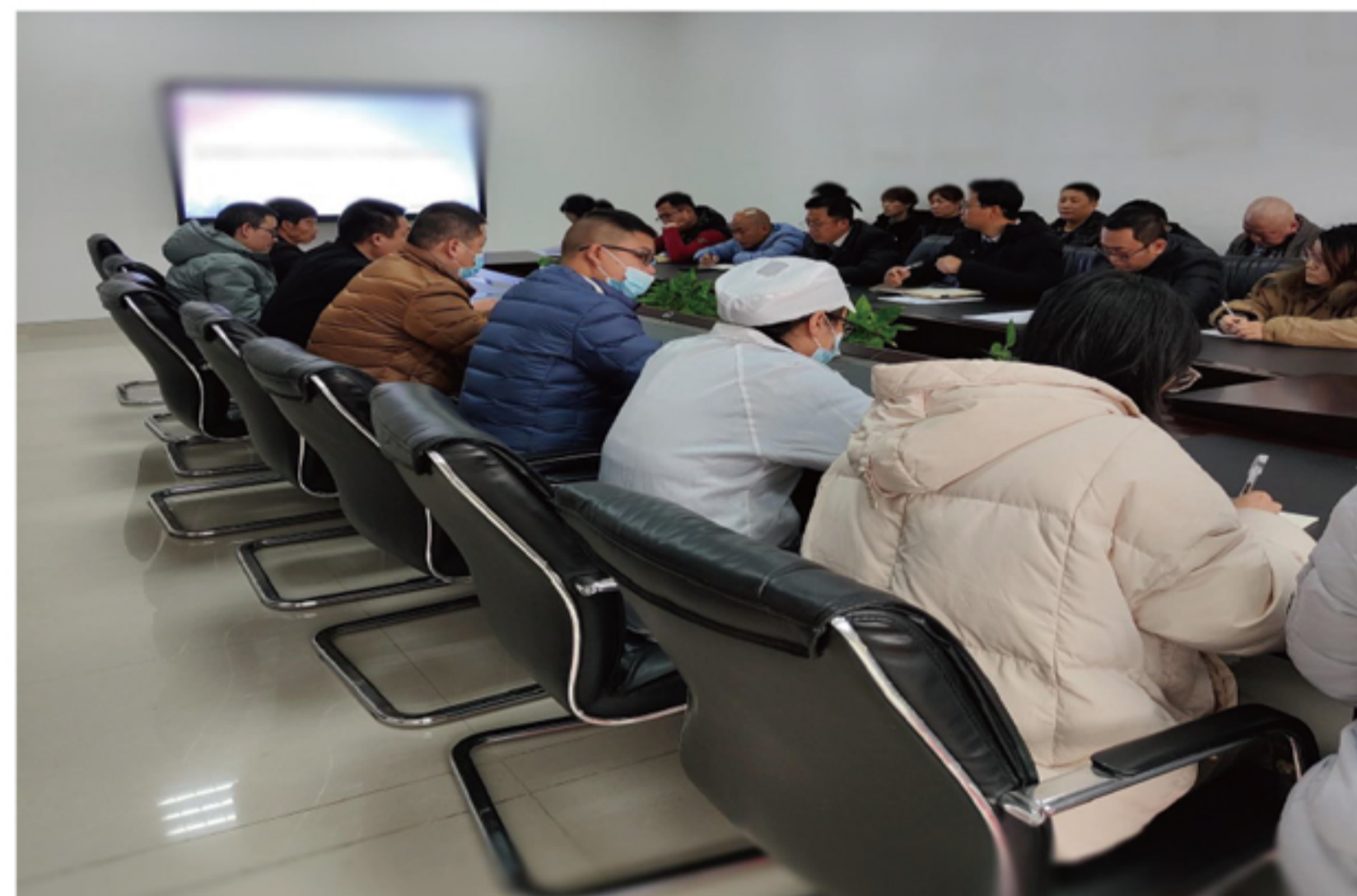
连城园区召开节后复工复产工作会议

春节过后，为确保完成全年各项目标任务，以晴集团针对节后复工复产工作进行统筹安排，积极组织集团各园区复工复产，即刻从“过年模式”转变为“工作模式”，调整工作状态，恢复工作秩序，全面启动节后生产工作。