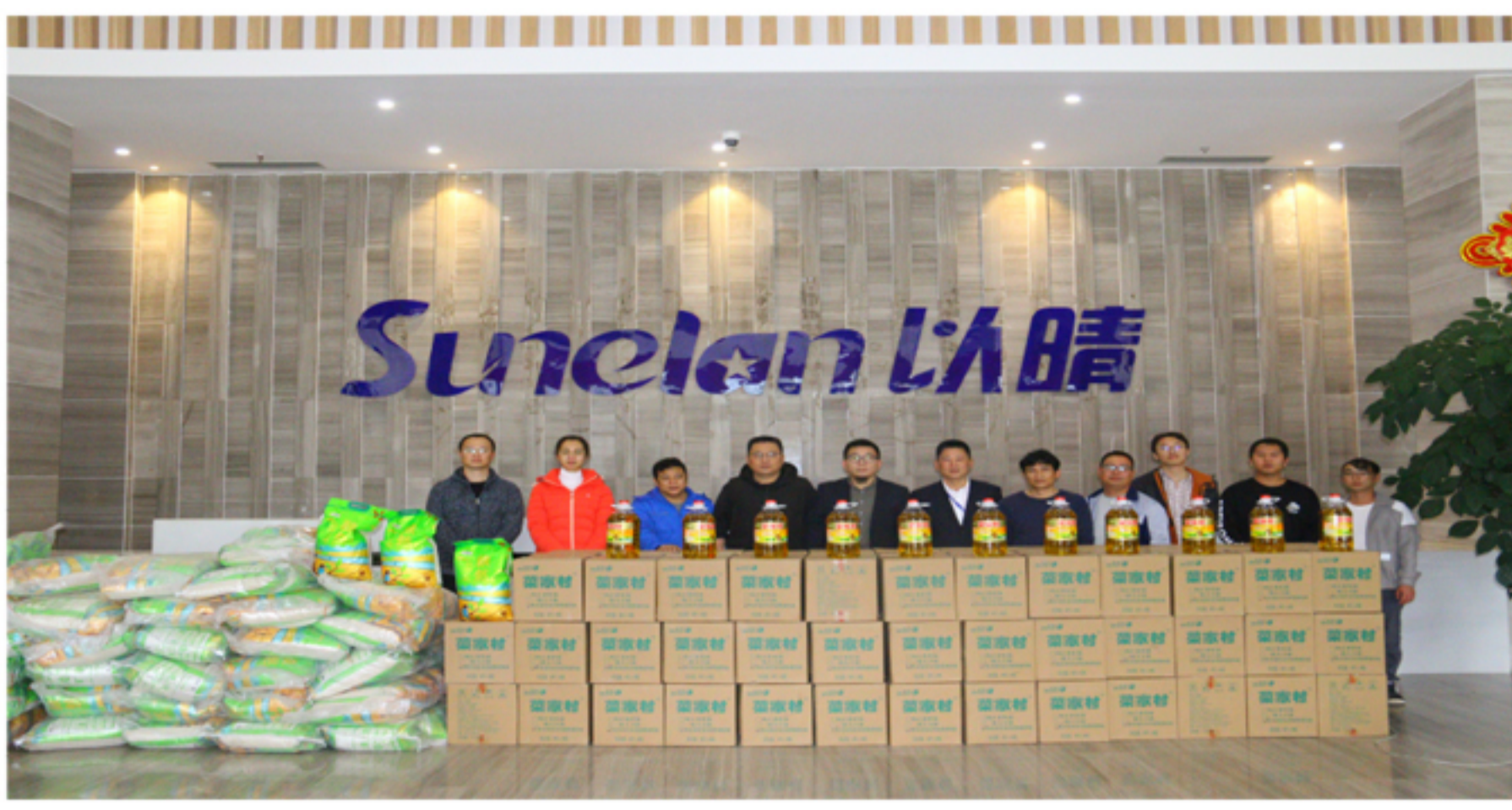
▲ 云南园区员工春节福利发放活动现场