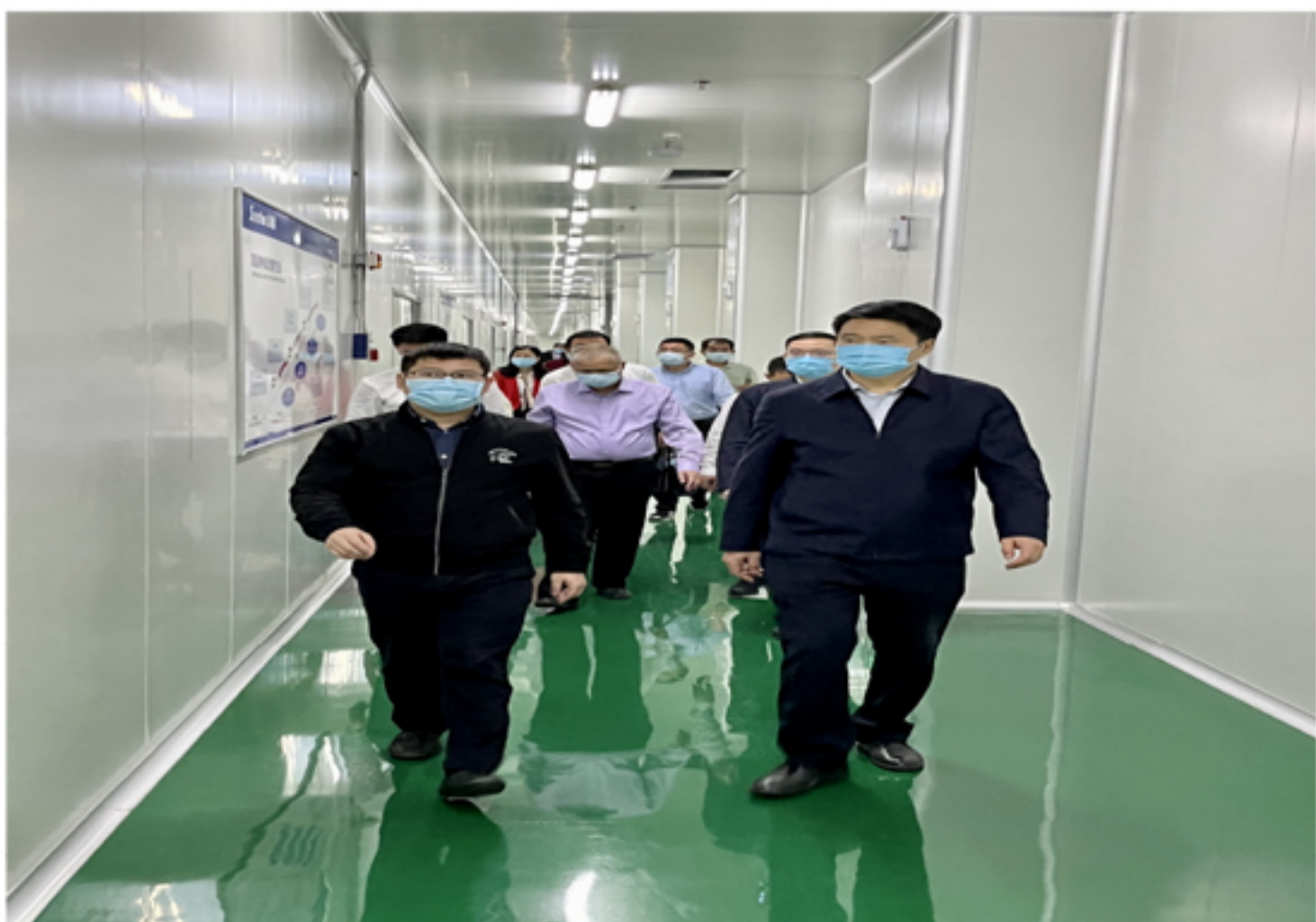
调研组一行视察企业生产车间