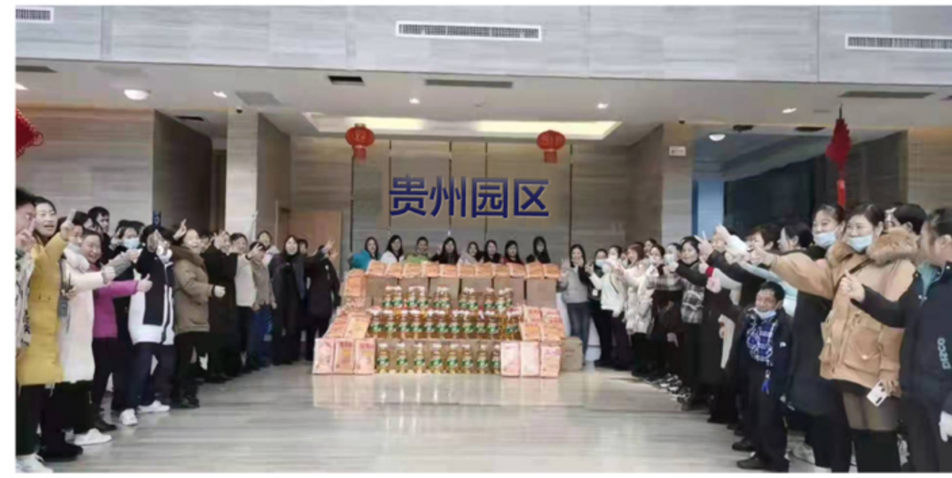
▲ 贵州园区员工春节福利发放活动现场