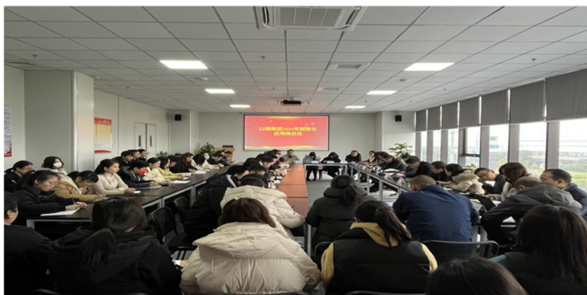
以晴集团2022年数智化应用推进会议现场