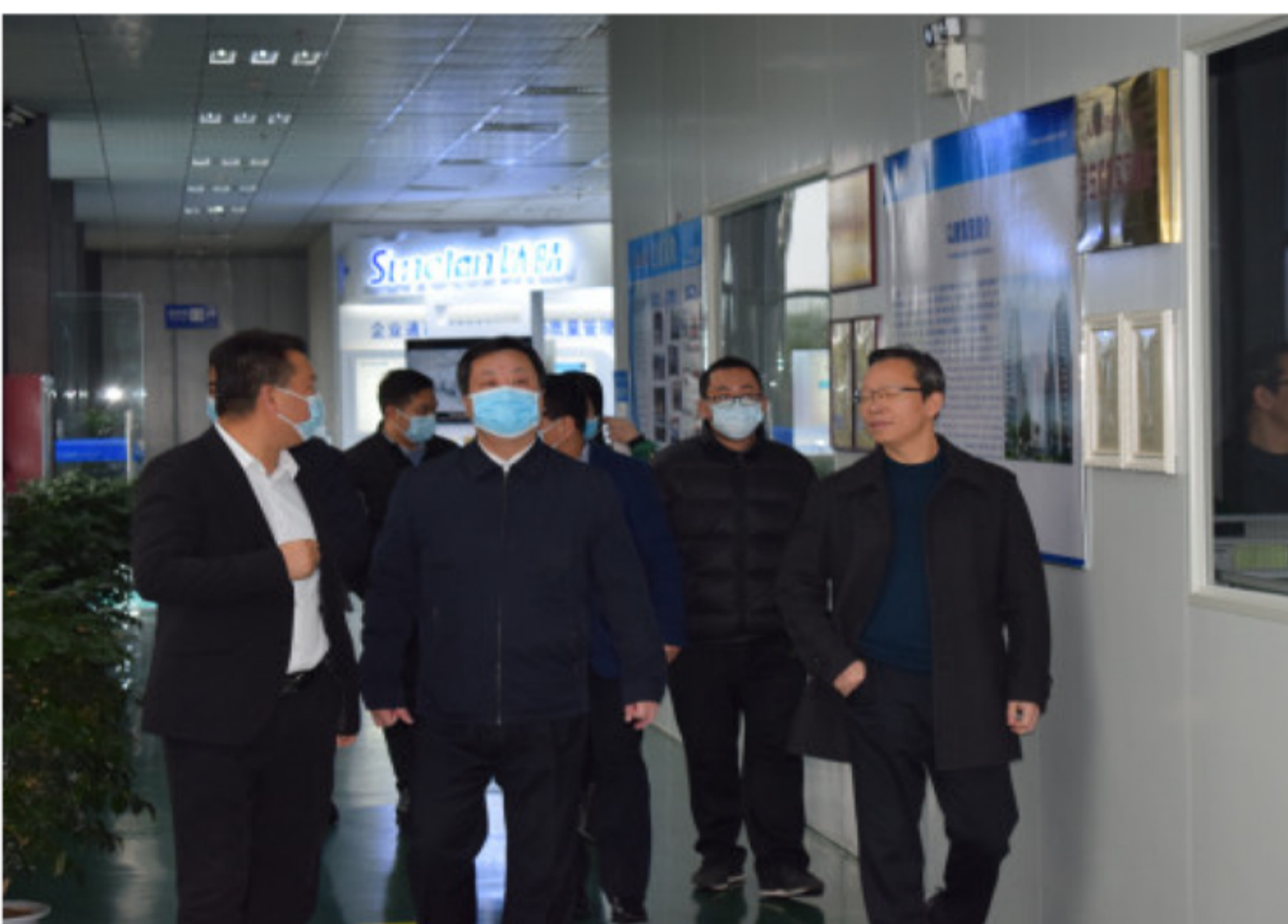
连城县委书记詹崇仁一行走进生产车间，察看企业复工复产情况