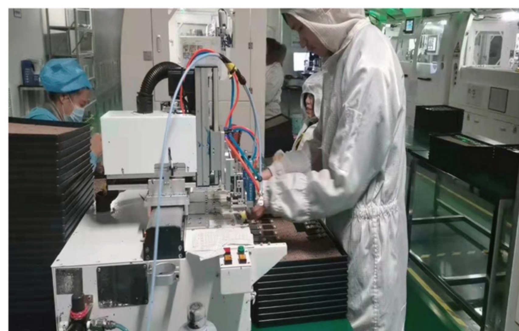
贵州园区各生产车间有条不紊推进生产提升产能

复工复产的集结号已吹响，以晴集团全体员工将继续秉持“开局就是决战，起步就是冲刺”的干劲投入到工作中，奋迎新挑战、担当新使命，为集团提质增效添砖加瓦。