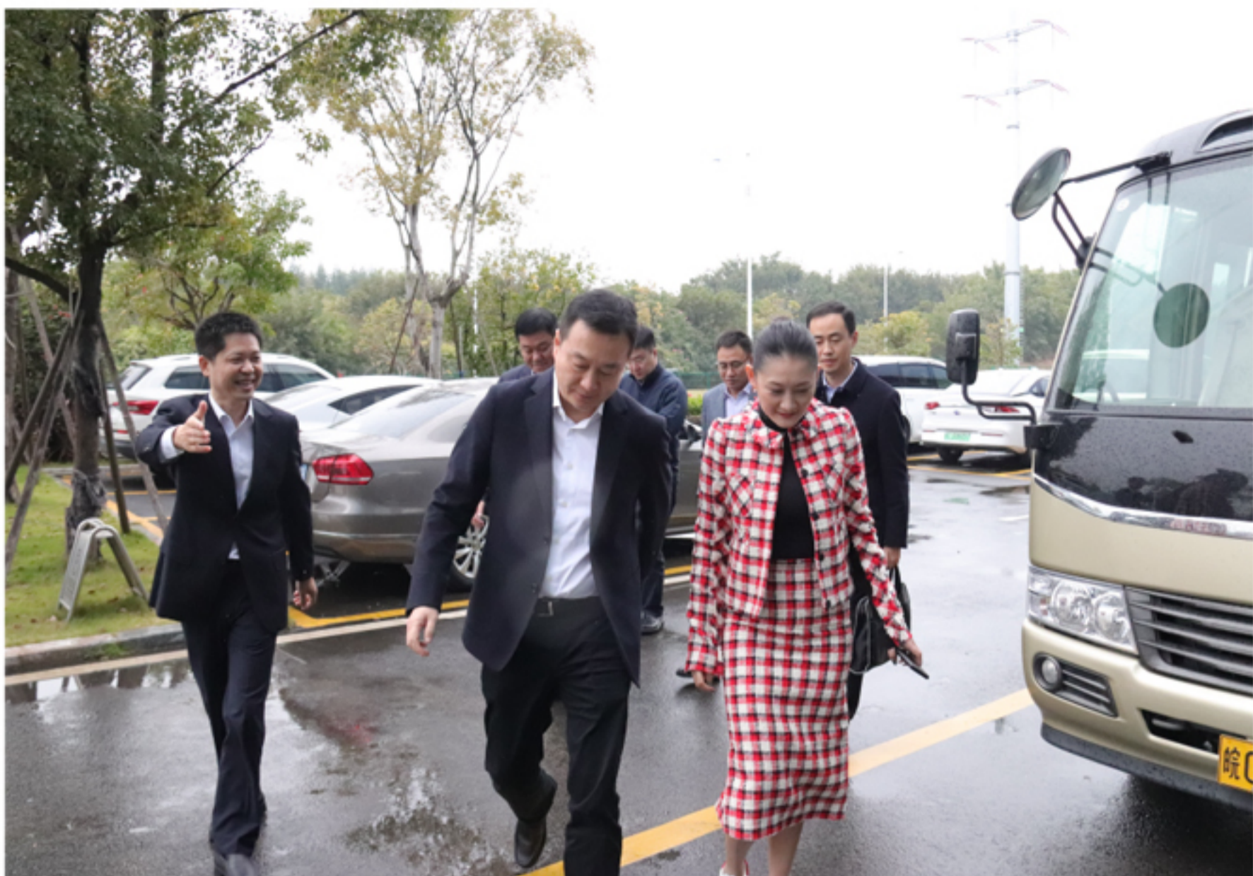
孔涛市长一行到中科智谷园区调研指导

在随后召开的座谈会上，周以晴董事长介绍集团发展历程，并汇报各地园区生产建设情况及下一步工作计划。孔涛市长介绍铜陵市产业规划、新兴产业发展情况，及铜陵市产业基础与发展优势，并向以晴集团发出邀请，希望以晴集团发挥行业优势，结合铜陵产业优势做大做强产业。