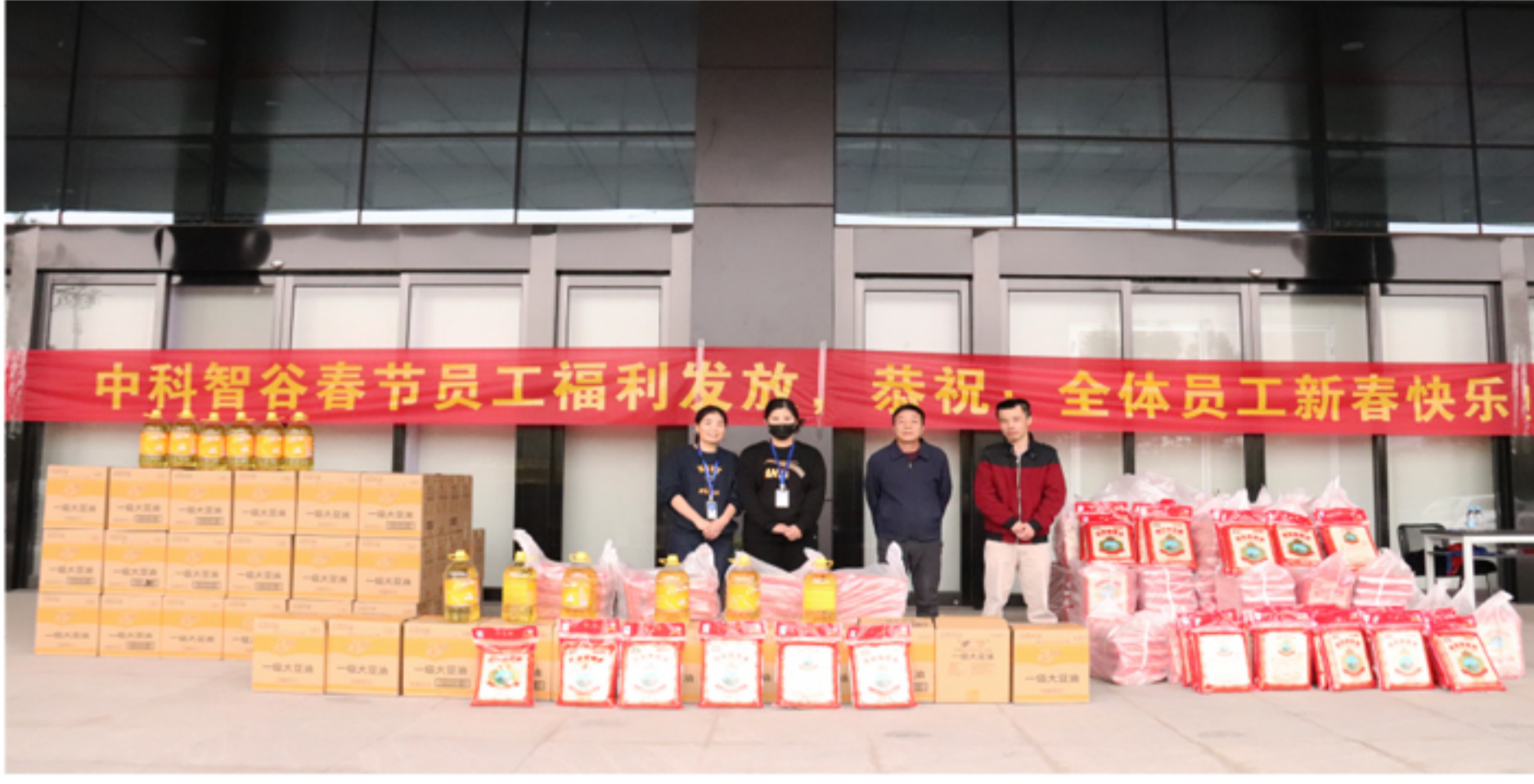
▲ 中科智谷园区员工春节福利发放活动现场

以晴集团始终坚持以人为本的理念，把企业发展和员工福祉紧密结合，注重工作、生活方面的点点滴滴，让员工感受到企业的关怀和温馨，真正将员工自身发展与企业发展融合起来。春节福利发放是集团对员工一年来辛勤付出的肯定，也是集团领导心系员工的体现。暖心的福利不仅给每位员工带来了浓浓的春节祝福，也给大家的心里带来了信心满满的希望和劲头。大家纷纷表示一定会将集团领导的关怀和关心化为2022年的工作动力，以企为家、爱企如家，为集团发展贡献力量。