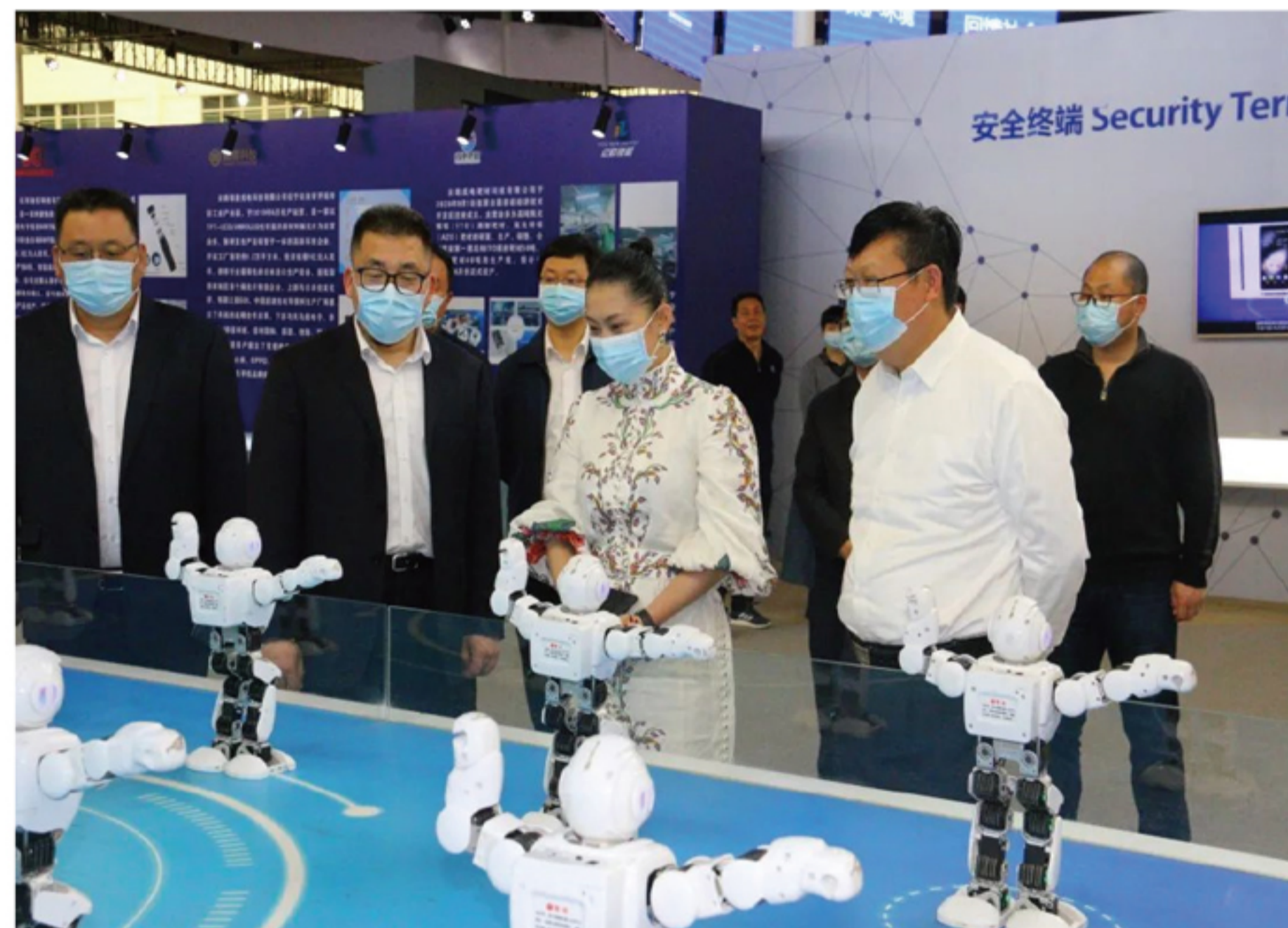
调研组一行详细了解智能机器人产品