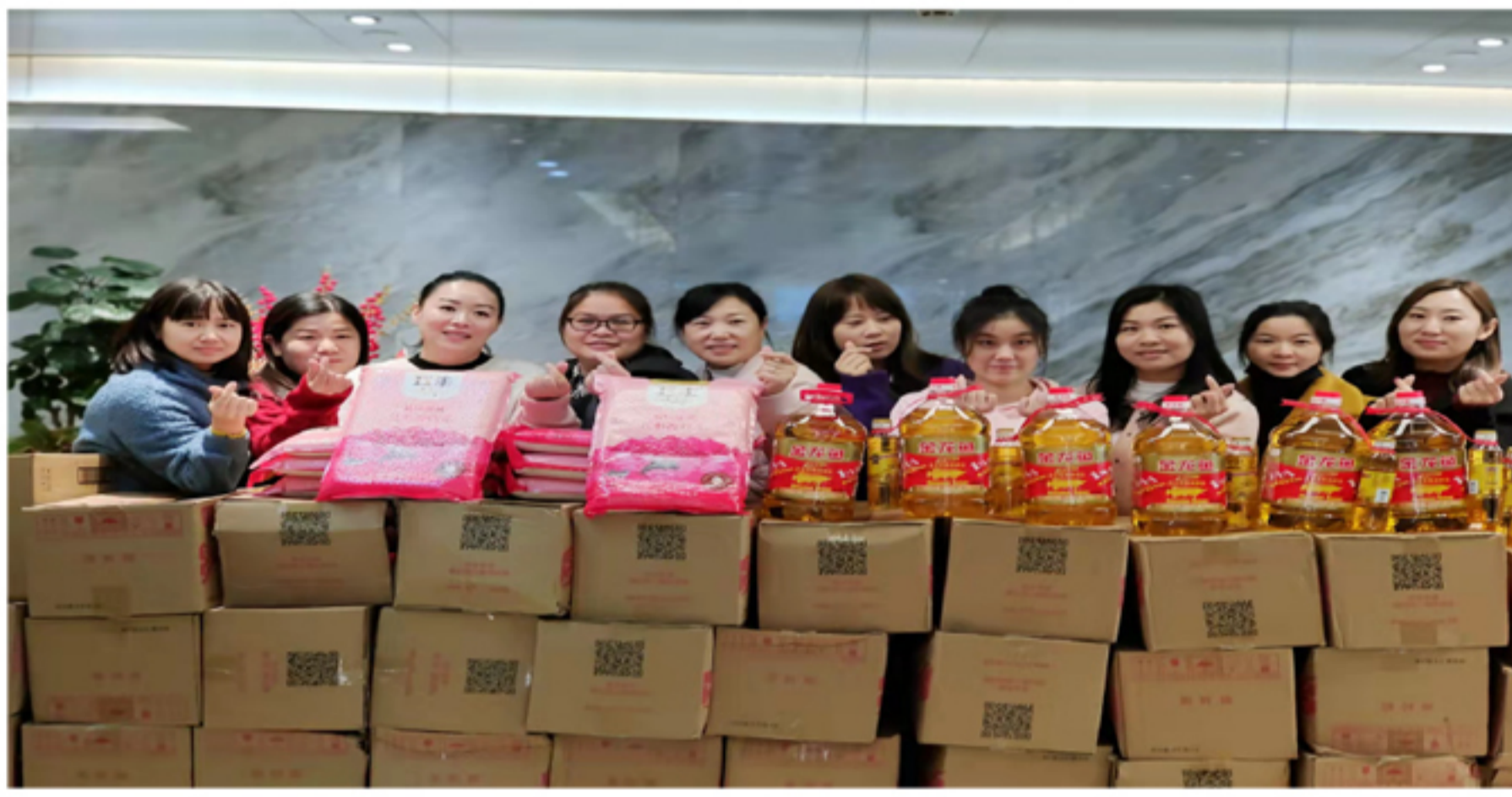
▲ 深圳分公司员工春节福利发放活动现场