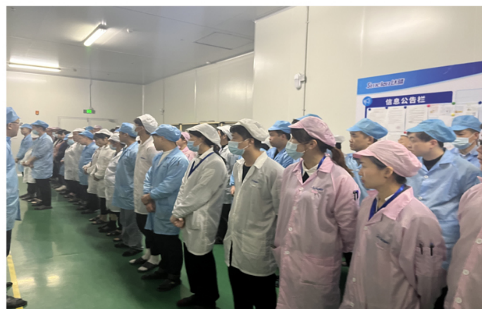
中科智谷园区管理干部到各车间安排复工复产工作