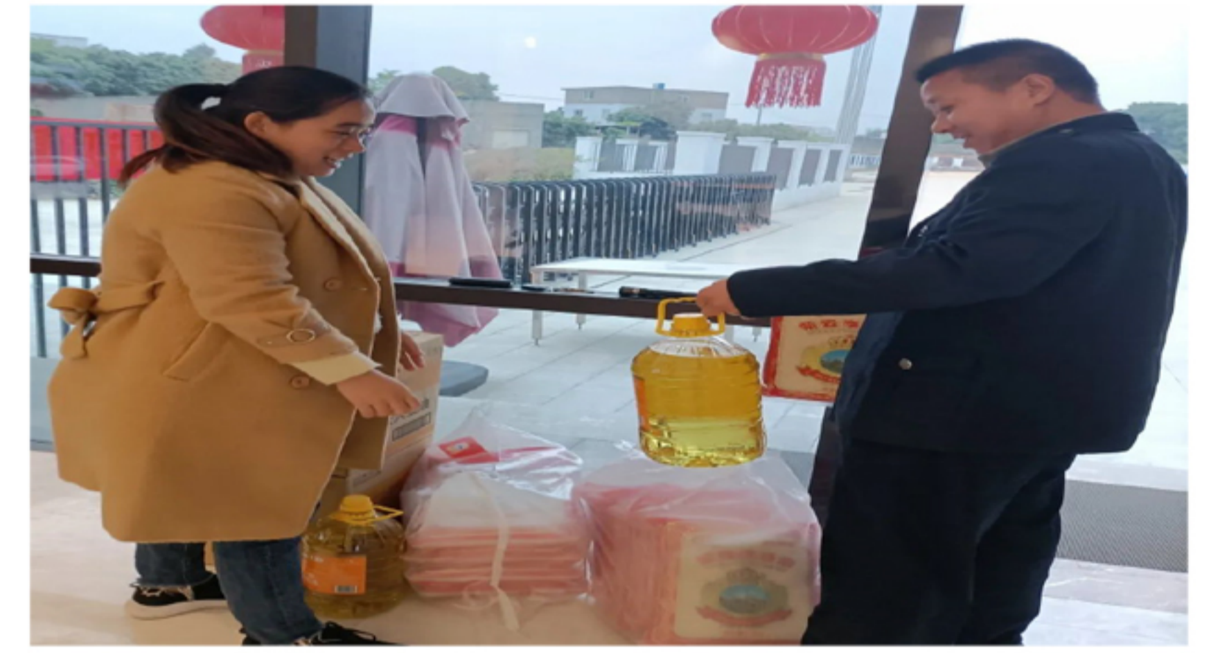
▲ 厦门园区员工春节福利发放活动现场