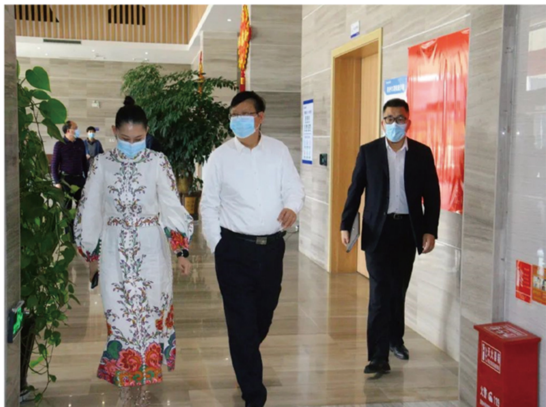
调研组一行到以晴红河科技产业园调研指导

寇杰厅长表示，省工信厅始终坚持走出去、沉下去、贴上去服务企业，对接企业需求，帮助企业解决问题，同时也是来学习交流，加强对行业特别是对基层具体情况的了解，进一步健全工作机制、畅通沟通渠道，同时也鼓励企业要发挥自身优势，进一步夯实产业支撑，不断培育壮大特色优势产业，助推红河州企业高质量发展。