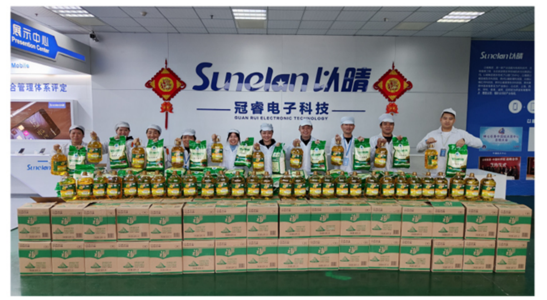
▲ 连城园区员工春节福利发放活动现场