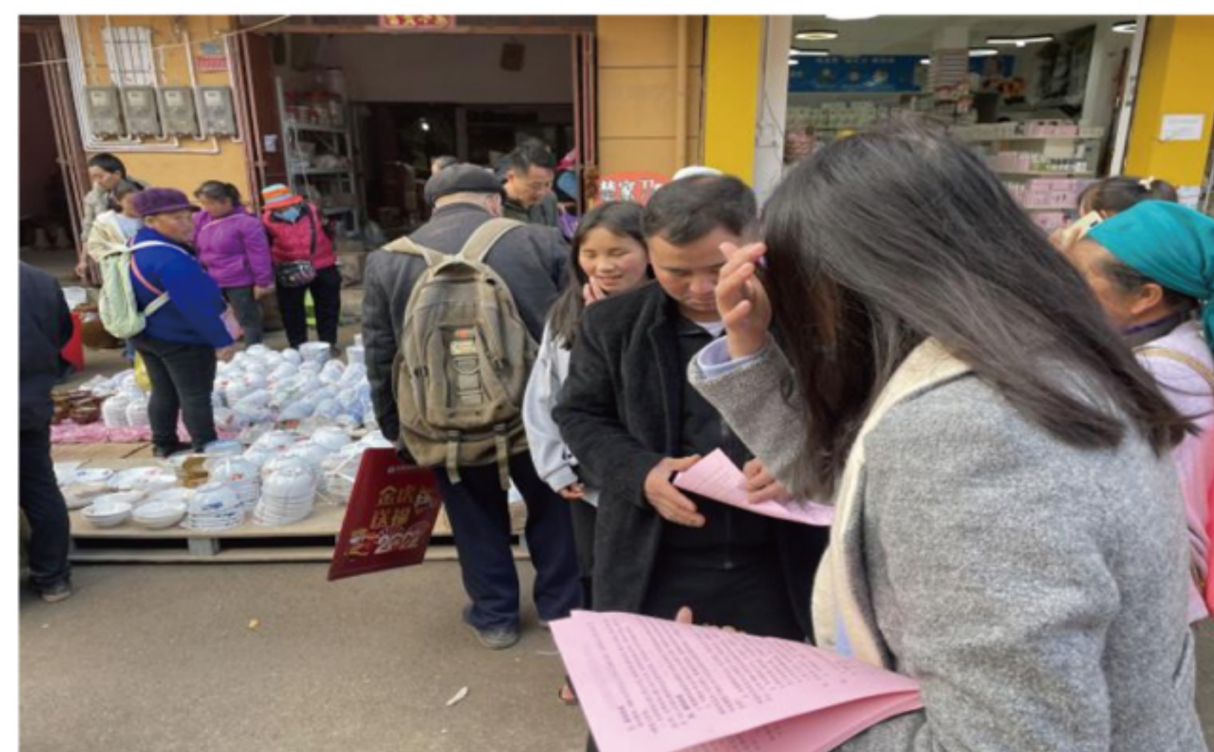
云南园区开展扫盘式招聘活动